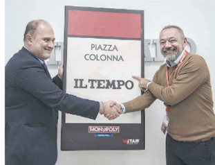
Nei negozi da oggi. La versione della città eterna che ci porterà alla scoperta dei luoghi più belli. Ieri a Piazza Colonna presentata la casella dedicata a «Il Tempo»