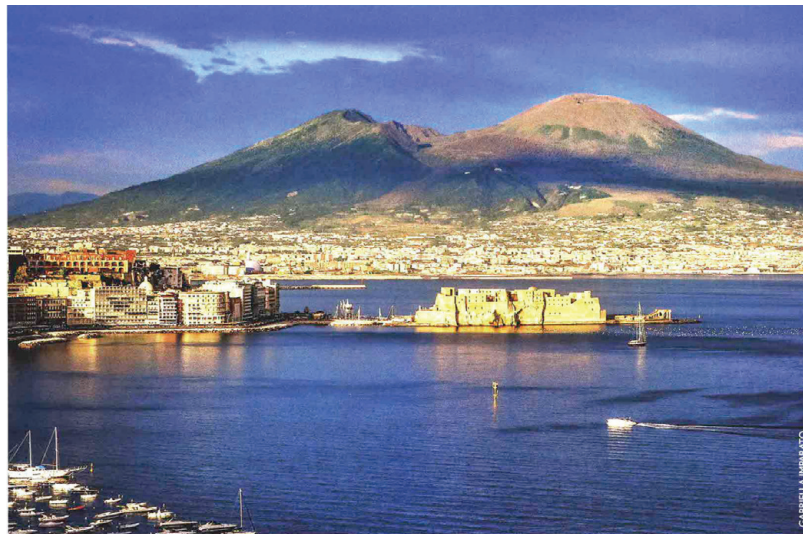
A sinistra, il tramonto sul golfo di Napoli con Castel dell'Ovo e il Vesuvio sullo sfondo. Sotto, la basilica di San Francesco di Paola e l'emiciclo ottocentesco di Leopoldo Laperuta nella celebre piazza del Plebiscito.

TRA IL VESUVIO E IL MARE, LA CITTÀ RISERVA SORPRESE E VARIE SQUISITTEZZE