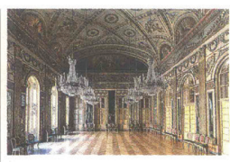
Mesi A destra, scorcio della Cappella della Sacra Sindone; sopra, il Circolo del Whist; a sinistra, Venaria Reale dove si terrà il gran ballo. Le immagini, firmate da Massimo Listri, scandiscono i mesi del calendario